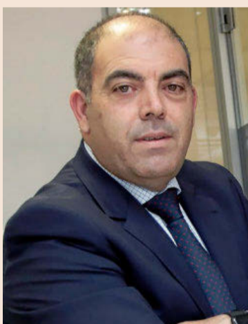
LORENZO AMOR Presidente de ATA

Confiamos en que el nuevo gobierno tenga la estabilidad y los apoyos para aprobar reformas económicas que contribuyan a reforzar la economía. El Gobierno deberá priorizar medidas que estimulen la actividad empresarial.