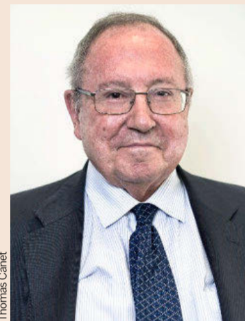
JOSÉ LUIS BONET Presidente de la Cámara de España

España necesita un Gobierno sólido y estable, sin postulados extremistas, con vocación y capacidad de culminar la legislación y terminar con la incertidumbre política. Son necesarias reformas fiscales y laborales que se adapten al nuevo marco empresarial.