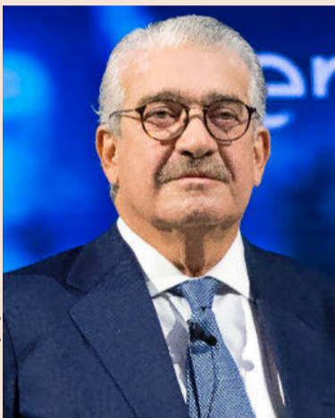
JOSÉ BOGAS Consejero delegado de Endesa

de la política económica y dar mayor estabilidad política para impulsar las reformas que permitan un crecimiento sostenible e integrador y adaptar nuestro país a las transformaciones globales ante la desa-