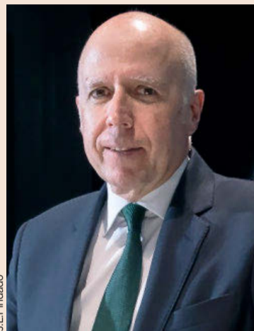
HILARIO ALBARRACÍN Presidente de KPMG España

Necesitamos un Gobierno capaz de consolidar el crecimiento de la economía y de elaborar una hoja de ruta clara para impulsar la actividad económica, facilitar las inversiones y atraer y retener al mejor talento para ser competitivos en el exterior.