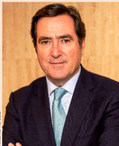
ANTONIO GARAMENDI Presidente de la CEOE