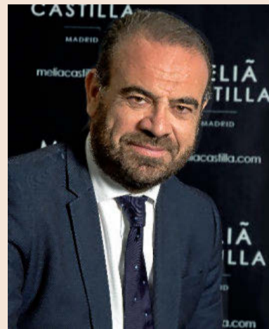
GABRIEL ESCARRER CEO de Meliá y presidente de Exceltur

También coinciden en reclamar cambios en estos te-