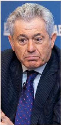
VALENTÍN PICH Presidente del Consejo General de Economistas

“Las elecciones ya estaban descontadas, con lo que no creo que el impacto en la economía vaya a ser reseñable y abre una esperanza para el futuro. Lo deseable es que haya capacidad de formar gobierno para cuatro años”.