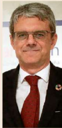
JAIME MALET Presidente de la Cámara de Comercio de EEUU en España

“ Para las empresas el escenario más favorable es que pueda formarse un gobierno estable que afronte las reformas que necesita nuestra economía para seguir creciendo y creando empleo”.