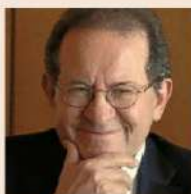
VÍTOR CONSTÂNCIO , exvicepresidente del BCE

"Las fusiones bancarias ya no son tan atractivas" P12 y 13