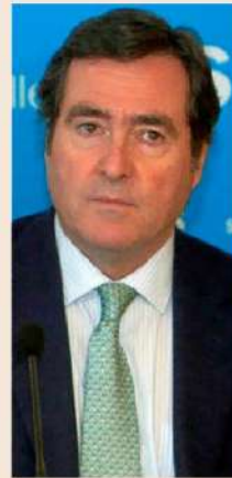
ANTONIO GARAMENDI Presidente de la CEOE

“ La convocatoria de elecciones es buena noticia. Pero si no se formara gobierno sería un desastre. Hay que intentar trasladar que un país como España no puede vivir un periodo largo de incertidumbre”.